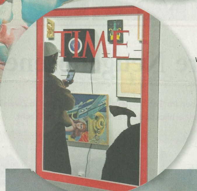
Wollten Sie schon einmal auf der Front des «Time-Magazine» erscheinen? In diesem Spiegel ist es möglich.

VON JEANETTE WICHMANN/GSTADLIFE ÜBERSETZT VON PAM